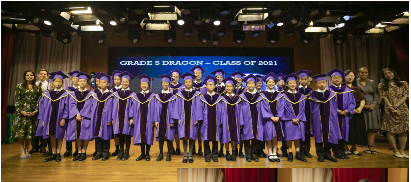
Grade 5 Dragon