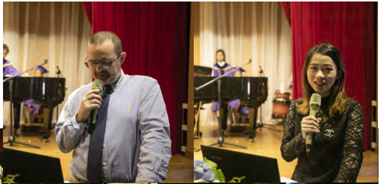
Grade 5 Tiger