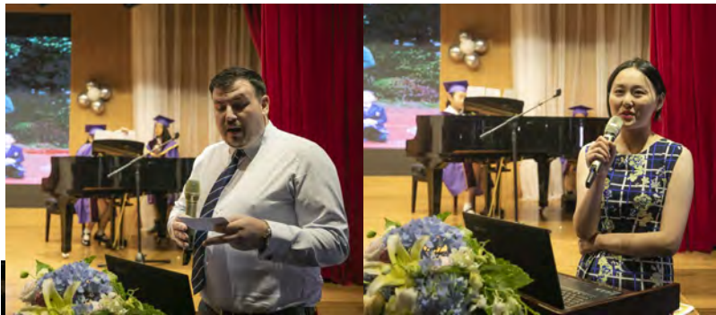
Grade 5 Panda